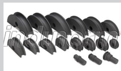
Rohrbiegematrizen Art.Nr.: RBM-ff. (siehe Tabelle links)