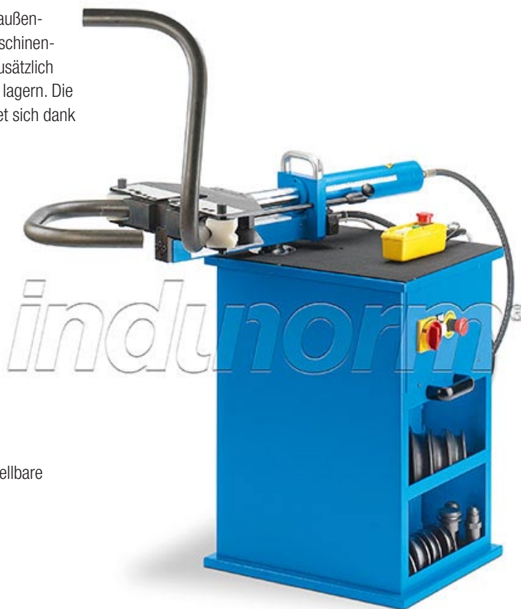
Abbildung: Lieferung erfolgt ohne Rohrbiegematrizen.