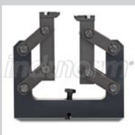
Univer. Nippelanschubwerkzeug Bogenarmaturen DN 06 - 51 Art.Nr.: NEV-WFB-2